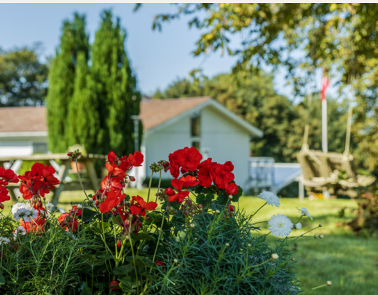
Opholdsstedet FYRET bliver drevet som en almenvælgørende fond.